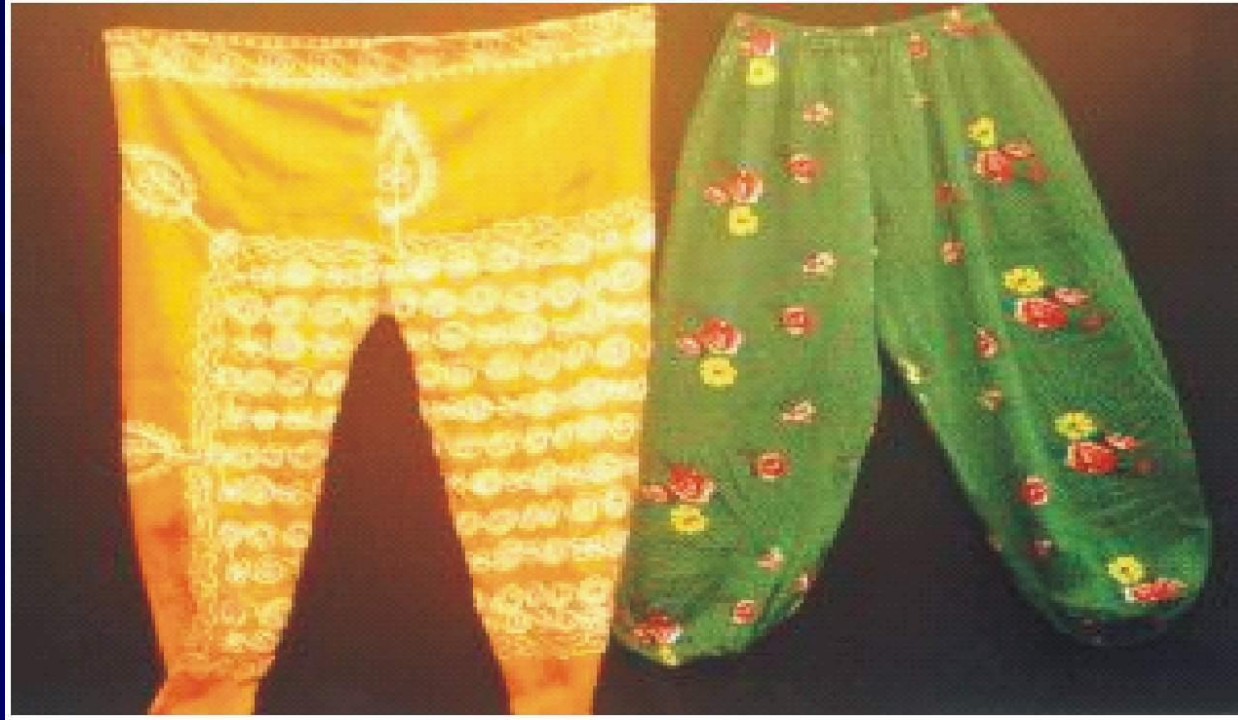
ŞALVAR (UZUN DON)