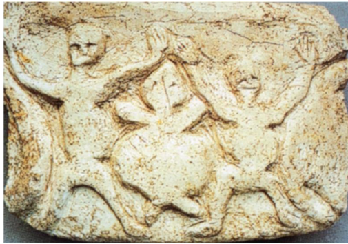
Neval, Çori Buluntular,

M.Ö.8000-67000, M.Ö.3000-2800 yılları arasında sürekli olarak iskân edilen bu alanda küçük buluntular olarak çakmaktaşı, taş, bakır, altın, gümüş, çamur ve kireçten yapılmış ok uçları, ve kazı araçları bulunmuştur. Bunun yanında, kadın ve erkek figürinleri, kireçten yapılmış hayvan figürinleri ve çok sayıda insan başına rastlanmıştır. Neval, Çori yerleşmesi, insanların yerleşik hayata geçmeye başladığı, bu yerleşimdeki bitki ve hayvanlar, evcilleştirmeye çalışıldığı, bir dönemi yansıtan bir depo olarak kullanılabilecek çok sayıda taş yapılmış, bilinen en eski taban mozaiğinin, taştan yapılmış duvarlarla donatılmış kültür yapılmış ve birçok sanat eserinin bulunması, bu yerleşimin bu geçiş dönemine ait merkezi bir yer olduğunu göstermektedir.