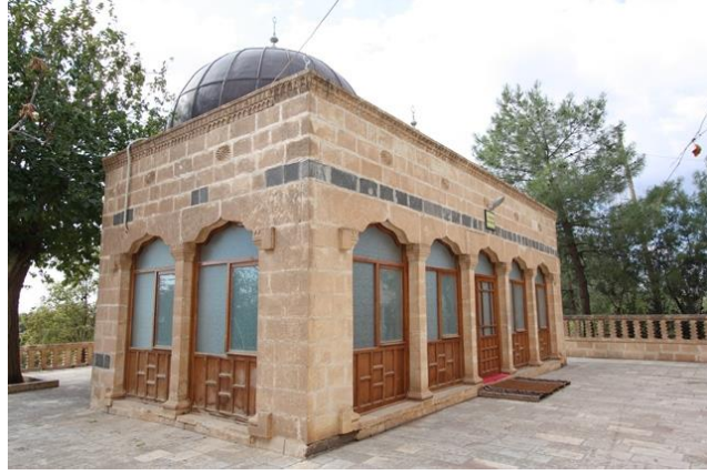
Eyyub Peygamber Türbesi

Ba dat seferi s,ras,nda bu köye u rayarak mezarlar, ziyaret eden Osmanl, padi ah, 4. Murat , çevredeki 17 köyün gelirini bu türbelerin bak,m, için vakfetmi tir. Yüzlerce y,ld,r bilhassa dini bayramlarda ve arife günlerinde bu mezarlar binlerce ki i taraf,ndan ziyaret edilmektedir. Efsâneye göre, Hz. Eyyub'un otururken s,rt,n, dayad, ,na inan,lan büyük bir bazalt ta " Sab,r Ta ," ise, türbesinin bat,s,ndad,r.