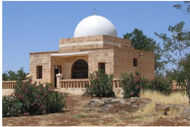
Elyesa Peygamber Türbesi

Ba dat seferi s,ras,nda bu köye u rayarak mezarlar, ziyaret eden Osmanl, padi ah, 4. Murat , çevredeki 17 köyün gelirini bu türbelerin bak,m, için vakfetmi tir. Yüzlerce y,ld,r bilhassa dini bayramlarda ve arife günlerinde bu mezarlar binlerce ki i taraf,ndan ziyaret edilmektedir. Efsâneye göre, Hz. Eyyub'un otururken s,rt,n, dayad, ,na inan,lan büyük bir bazalt ta " Sab,r Ta ," ise, türbesinin bat,s,ndad,r.