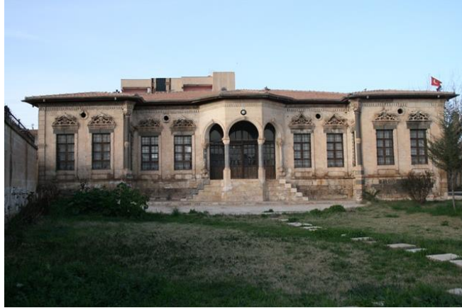
brahim Pa a Kona ,

brahim Pa a taraf,ndan yapt,r,lm, t,r. Pa a Kona , ve Pa alar Okulu olarak ta bilinen yap, uzun y,llar e itim amaçl, olarak kullan,lm, t,r. 1923 ten 1940d, y,llar,n sonuna do ru e itim ve ö retimin yürütüldü ü bu tarihi yap,, 1970 y,llar,ndan itibaren kaderine terkedilmi tir. 2000 y,l,nda özel idare taraf,ndan korunmaya al,nm, olan yap,, restore edilmi tir. Bugün İlçe Halk Kütüphanesi olarak hizmet vermektedir.